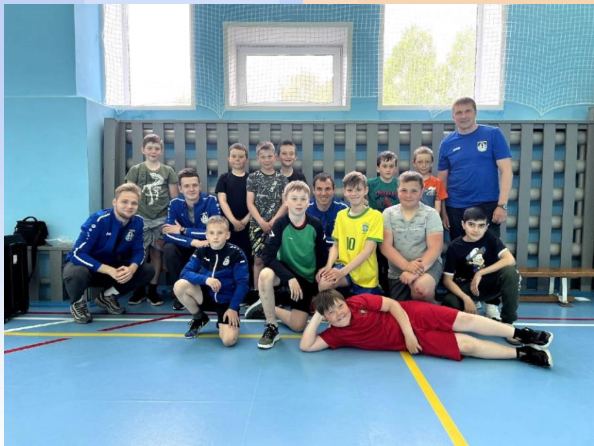
Тренировка с игроками ФК «Шинник»